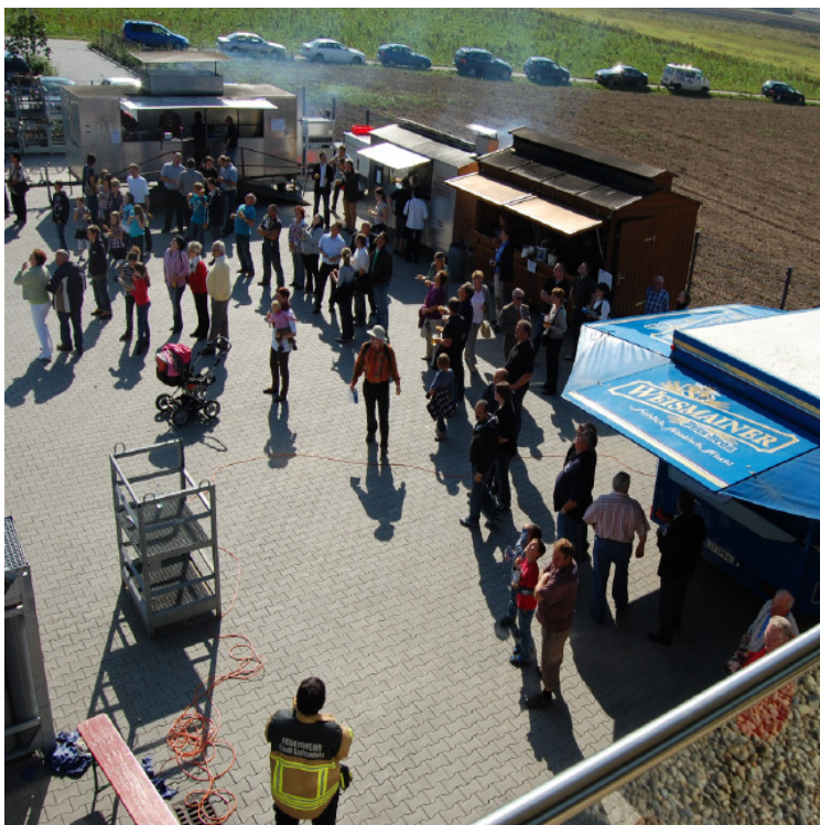
Warme Speisen und „Cryo-Cooking“