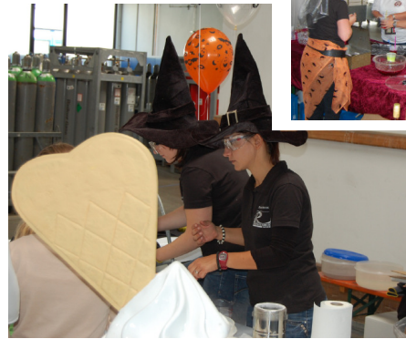
Spezialitäten mit Gasen zubereitet