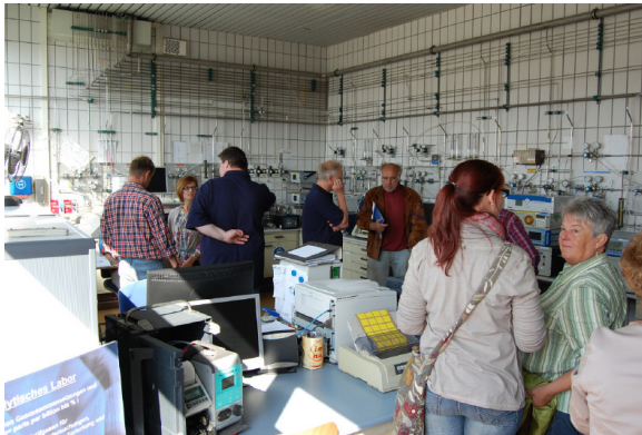
Fachgespräche und Information